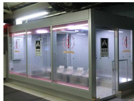
＜伊東線ホーム待合室＞