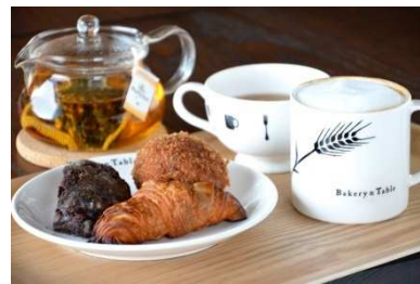
<ベーカリー&テーブル>