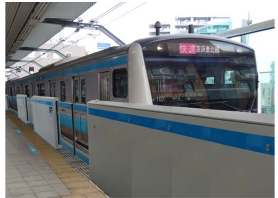
ホームドア設置イメージ（浦和駅）

工期は2016年7月から1年程度を予定しています。 ※使用開始日は、決まり次第あらためてお知らせします。