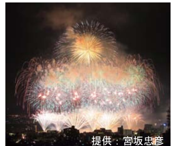
諏訪湖祭湖上花火大会(イメージ)