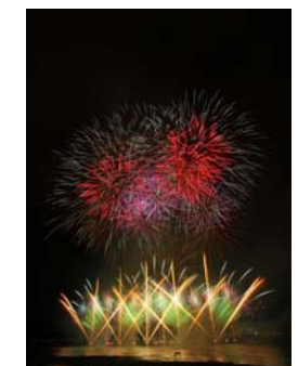
全国新作花火競技大会(イメージ)