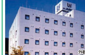
※お宿での宿泊手続きはお選ばれるクーポン類にてお客様自身でお願いいたします。 ※かつらぎ御苑では添乗員は同じ宿に宿泊しない場合があります。

洋室/バストイレ付(1~2名) 朝食/レストラン(バイキング) アクセス 新宮駅より徒歩約6分