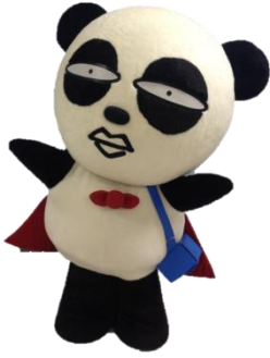
京成電鉄の マスコットキャラクター、京成パンダ