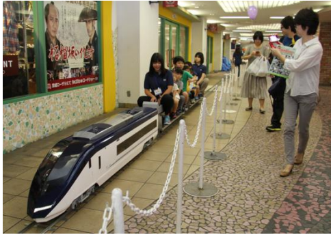
ミニスカイライナーの運行(イメージ)