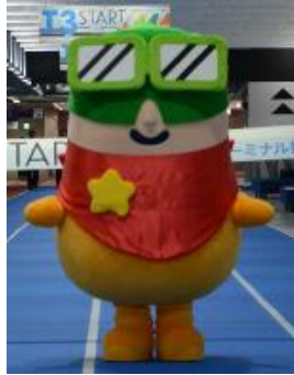
成田国際空港の マスコットキャラクター、クウタン