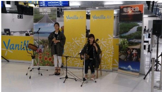
島唄ライブ(イメージ)