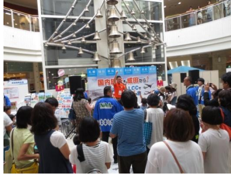
ジェットスターPR(イメージ)