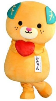
愛媛県の イメージアップキャラクター、みきちゃん