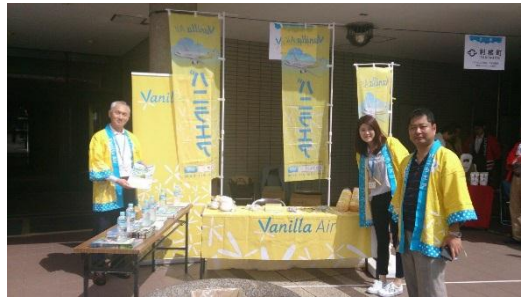
スタンプラリー(イメージ)