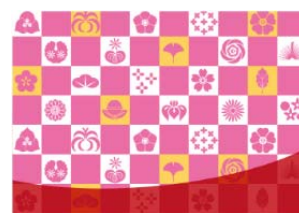
オリジナルあぶらとり紙(イメージ)

また、伊豆ならではの“いいもの”を揃えた「のもの」ショップを展開いたします。伊豆の伝統的な食材である「塩鯉」をはじめ、伊豆に暮らす地元の方々にも人気の商品を販売します。