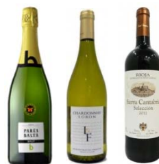
ワイン飲み放題プラン(イメージ)

往路(小田原→伊豆急下田間)3号車ご利用のお客さまには、オプションプランとして“ワイン飲み放題プラン”をご用意いたしました！最初にスパークリングワインを、お替りは赤ワインまたは白ワインからお選びいただけます！