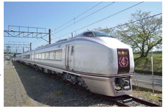
IZU CRAILE (伊豆クレイル)

JR東日本の首都圏エリアの主な駅にあるびゅうプラザまたは主な旅行会社、びゅう予約センター 0570-04-8928(携帯・PHS・IP電話・ひかり電話からは、03-3843-2001)、えきねっと( http://www.eki-net.com/travel/craile/ )にて発売いたします。