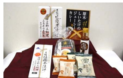
「のもの」ショップ商品(イメージ)

また、伊豆ならではの“いいもの”を揃えた「のもの」ショップを展開いたします。伊豆の伝統的な食材である「塩鯉」をはじめ、伊豆に暮らす地元の方々にも人気の商品を販売します。