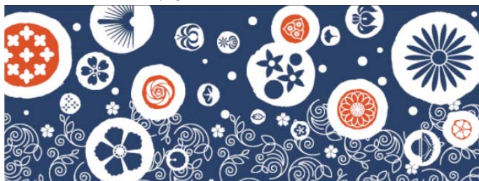
オリジナル手ぬぐい(イメージ)

車内では「IZU CRAILE」オリジナルグッズも販売。「かまわぬの手ぬぐい」と「鎌倉四葩(よひら)のあぶらとり紙」は、列車内に設置されている暖簾の紋様と、列車に施されている「櫻」「海風」「さざ波」のラインなどをモチーフにしたオリジナルデザインです。