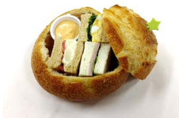
伊豆クレイルオリジナルブルサンド (箱根ベーカリー)

「IZU CRAILE」ではおつまみやスナックも伊豆や沿線のものを中心にご用意。オリジナルのフードメニューやドリンクも販売いたします。