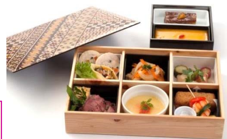
クレイルスタイル・サマーランチセット(イメージ)