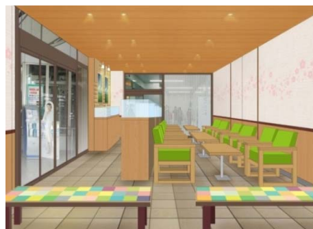
専用ラウンジ内観(イメージ)