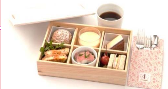
クレイルスタイル・アフタヌーンカフェセット(イメージ)