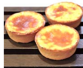
ニューサマーオレンジタルト