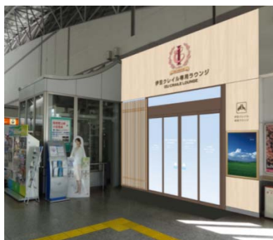
専用ラウンジ外観(イメージ)

ご利用可能日時：「IZU CRAILE」運行日 10:30～11:30(出発時刻10分前まで)