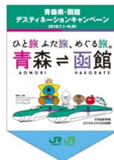
のぼり旗・フラッグ(イメージ)