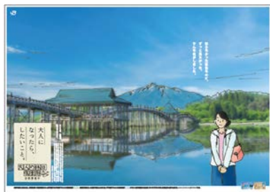
青森・津軽の逆さ富士篇(イメージ)