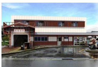
陸奥湊駅(イメージ)