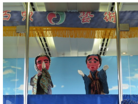
きんたまめじよ 【金多豆蔵人形芝居】