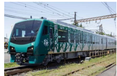
デザインは「KEN OKUYAMA DESIGN」 (代表：奥山清行氏)が担当しました

樺（ブナ）の木立ちをグラデーションで表現し、ナチュラルなグリーンの濃淡で優しい木漏れ日を感じさせるデザインとしました。