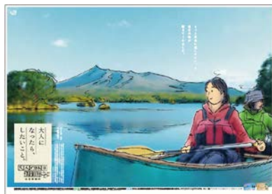
函館・北海道の夏篇(イメージ)