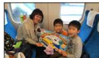
昨冬のファミリー車両の様子