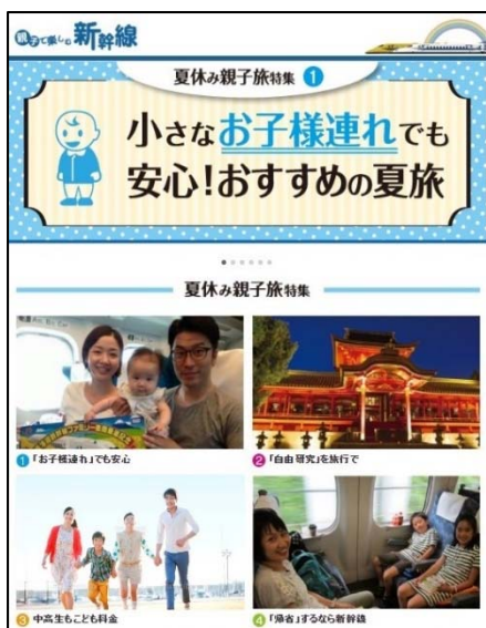
※画像はすべてイメージです