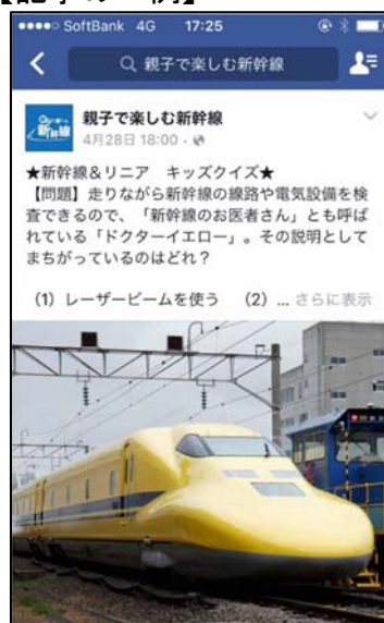
①新幹線&リニア キッズクイズ (クイズ記事)