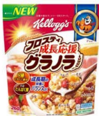
日本初*の子ども向けグラノラ