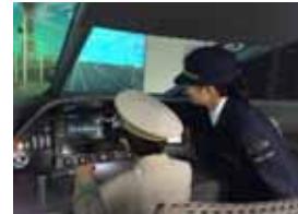
運転士の訓練体験