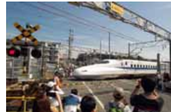
東海道新幹線唯一の踏切