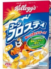
ケロッグのロングセラー