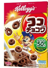
わかかの形が楽しい