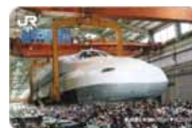
新幹線カード新デザイン