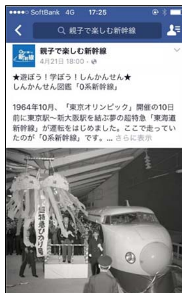
②遊ぼう！学ぼう！しんかんせん (コラム記事)