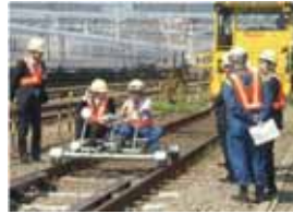
アルミカート乗車体験