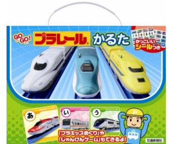
『GOGO! プラレールかるた』