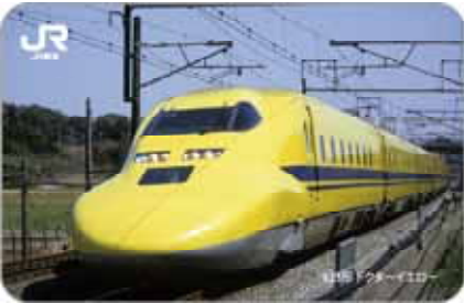
第1弾 923形 ドクターイエロー (平成27年10月～12月)