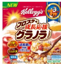
日本初*の子ども向けグラノラ