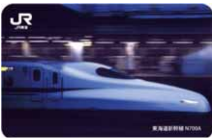
第2弾 東海道新幹線 N700A (平成28年1月～3月)