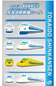
オリジナル新幹線シール