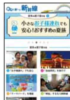
親子向け商品専用サイト