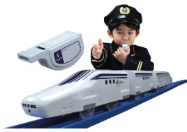
ふえではしるぞ！笛コン超電導