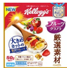
厳選した大きめカットの贅沢フルーツを使用した