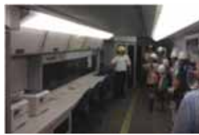
ドクターイエロー車内見学