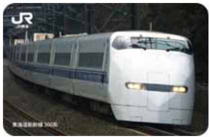
第3弾 東海道新幹線 300系 (平成28年4月～6月)