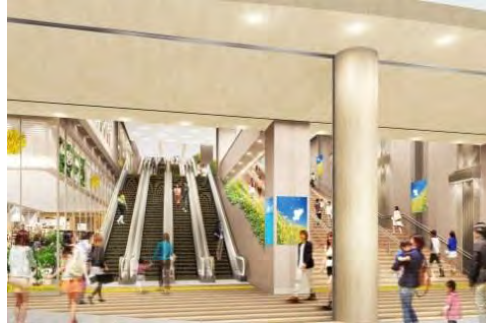
千葉駅改良・駅ビル建替