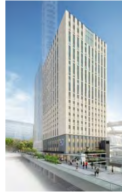
さいたま新都心ビル(仮称)