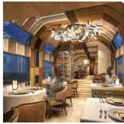
TRAIN SUITE 四季島