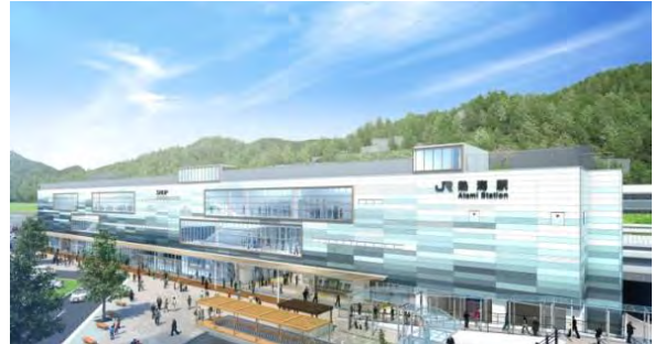
熱海駅改良・駅ビル建替