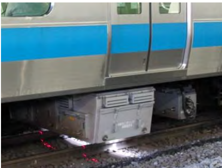
線路設備モニタリング