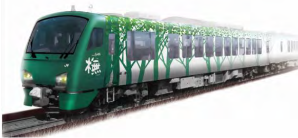
リゾートしらかみ「撫(ブナ)」