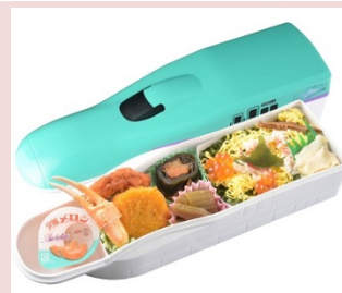
北海道新幹線H5系型のプラ容器に北海道らしい 海鮮ちらし寿司とおかずを盛り付けました。 【北海道新幹線弁当】 1,300円（税込）