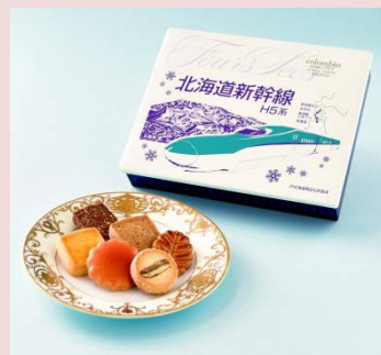
北海道新幹線開業記念パッケージ！ 【北海道新幹線フルセック】 1,296円（税込）