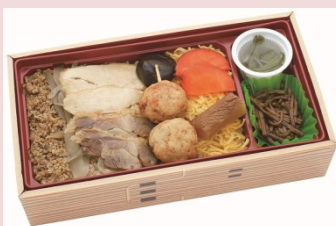
日本三大地鶏の比内地鶏を使用したこだわりの 鶏めしです。比内地鶏の照り焼きとつくね、 ゴマそぼろをお楽しみください。 【秋田比内地鶏こだわり鶏めし】 1,000円（税込）