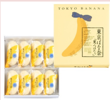
東京みやげの大定番「東京ばな奈」 【東京ばな奈「見つけたっ」8個入】 1,029円（税込）