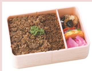
自家製のタレで味付けした牛肉煮と牛そぼろ煮を ふっくらと炊き上げた山形県産米「どまんなか」 の上に敷き詰めた駅弁です。 【牛肉どまん中】 1,150円（税込）