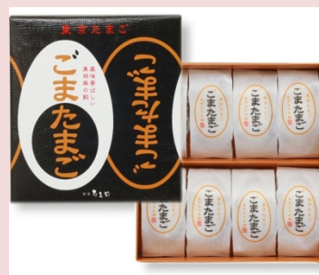
黒ごまが香しい、かわいい玉子型のお菓子 【東京たまご ごまたまご 8個入】 720円（税込）