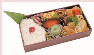
浅草今半の牛肉佃煮や、魚久のキングサーモン 粕焼、日本ばし大增の野菜のうま煮と老舗の味 を詰合せた贅沢なお弁当です。 【東京弁当】 1,650円（税込）