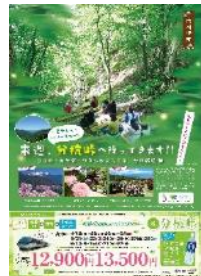
伊那市 タイアップポスター