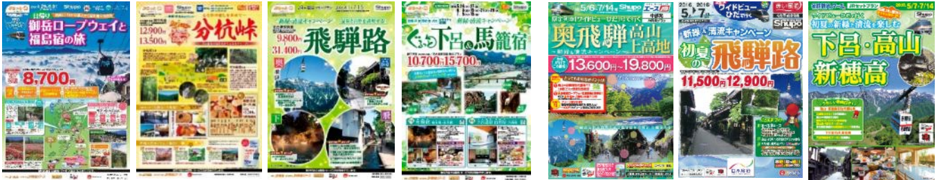
ジェイアール東海ツアーズ ツアー商品