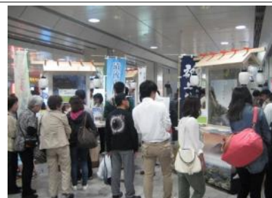
昨年度のイベントの様子