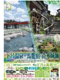
下呂市・中津川市 タイアップポスター