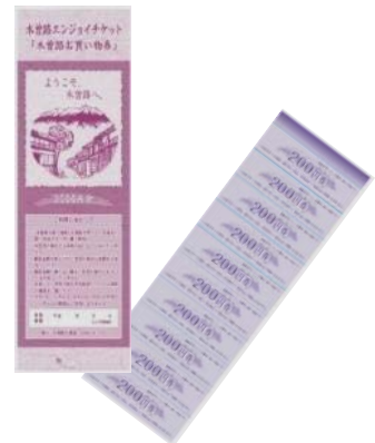
木曽路お買い物券