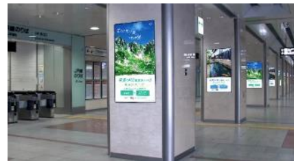
名古屋駅デジタルサイネージ