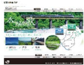
観光情報サイト 「Shupo [シュポ]」

キャンペーン専用ページを公開し、沿線にある初夏のおすすめの観光地などをご紹介します。(http://shupo.jr-central.co.jp/)