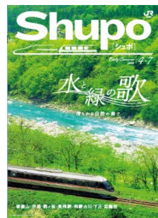
観光情報誌 「Shupo[シュポ]」