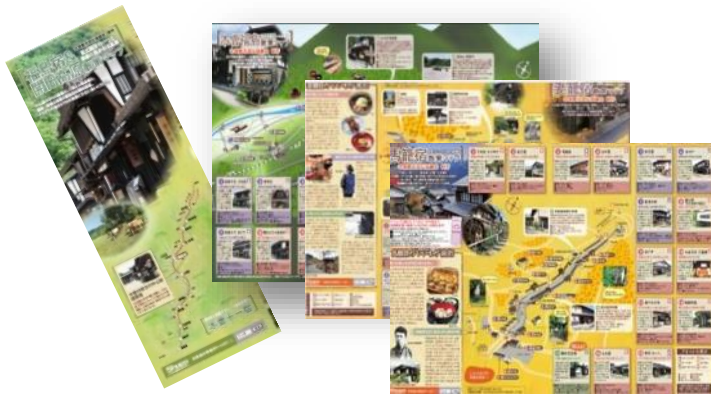
宿場町散策マップ