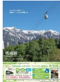
奥飛観光開発(株) タイアップポスター