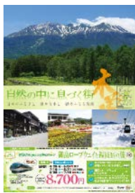
木曾町 タイアップポスター