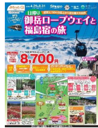
ツアー商品の一例