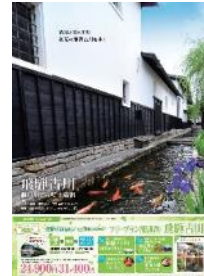
飛騨市 タイアップポスター