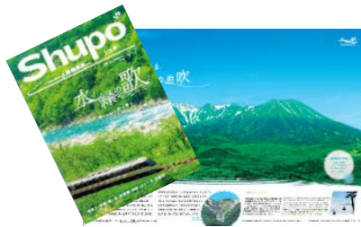
「Shupo [シュポ]」パンフレット

初夏の魅力あふれる列車の旅が楽しめるツアー商品などを掲載したパンフレットや、地元の皆様と連携したポスターを、JR東海の主な駅（一部駅を除く）で掲出します。また、名古屋駅の中央コンコースのデジタルサイネージでも、おすすめの観光地の情報を発信します。