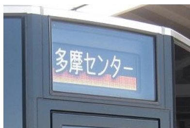
フルカラーLED正面行先表示器

NPO法人カラーユニバーサルデザイン機構が情報提供などに当たって、色覚タイプの違いを問わず、より多くの人に利用しやすいものとなるよう、カラーユニバーサルデザインの配慮がなされていることを認定して発行するマークです。