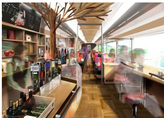
3号車 フードカウンター※

2016年3月31日に、新型「樺」編成3号車の製作の様子を報道公開する予定です。詳細については別途お知らせいたします。