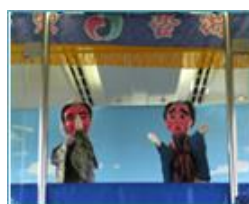
金多豆蔵（イメージ）