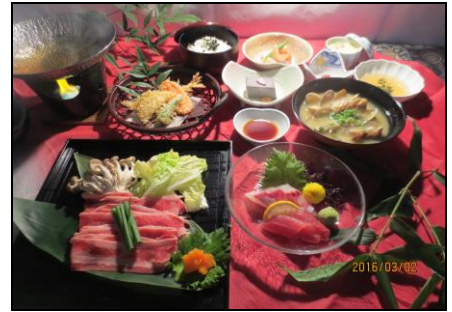
〈昼食「牛しゃぶ御膳」/イメージ〉