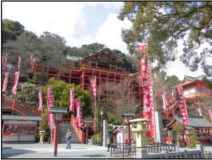
〈祐徳稲荷神社/イメージ〉