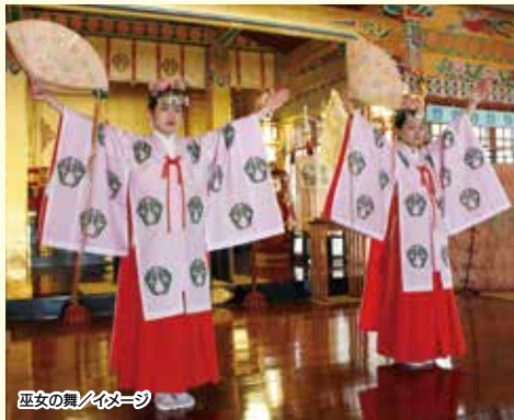
巫女の舞/イメージ

巫女の舞 祭祀を司る巫女自身の上に神が舞い降りるといふ神がかりの儀式のために行われた舞。