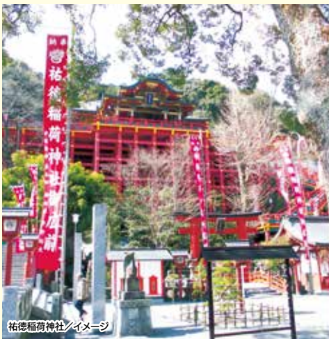
祐徳稲荷神社/イメージ

巫女の舞 祭祀を司る巫女自身の上に神が舞い降りるといふ神がかりの儀式のために行われた舞。