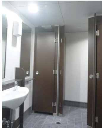
▲女性トイレ (パウダーコーナー)