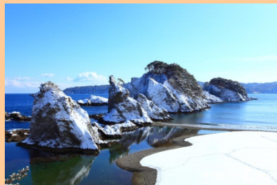
浄土ヶ浜 (イメージ)

三陸復興国立公園の中心をなす浄土ヶ浜は、宮古の代表的な景勝地です。鋭く切った白い流紋岩が林立し、一つ一つ違った表情を見せて海岸を彩ります。松の緑と岩肌の白、海の群青とのコントラストはまさに一見の価値あり。浄土ヶ浜の地名は、天和年間(1681~1684)に宮古山常安寺七世の霊鏡菴湖(1727年没)が、「さながら極楽浄土のごとし」と感嘆したことから名付けられたと言われています。