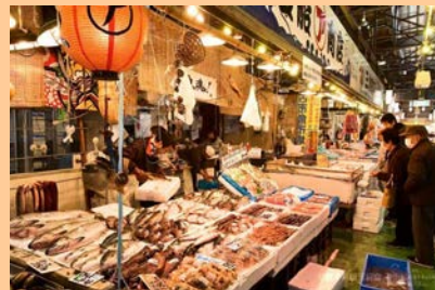
宮古市魚菜市場 (イメージ)

三陸沖から水揚げされた新鮮な魚介類や海産物加工品、地元農家が育てた野菜がずらりと並び市場。多数のお店が軒を連ねるほか、中央広場では農家のお母さんたちが自慢の野菜を販売しています。宮古市民の台所とも言われ、人情にあふれた交流市場です。お土産用に梱包、発送もしてくれます。