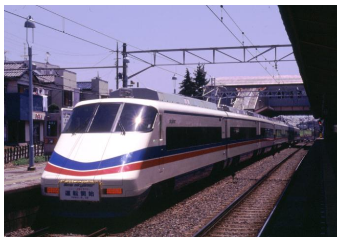
運行開始当初のAE100形

これは、京成電鉄の2代目「スカイライナー」用車両として1990年に運行を開始し、2010年からは「シティーライナー」用車両としても皆様に親しまれ、昨年12月で定期運転が終了となった「AE100形」の引退を記念して、京成電鉄の後援により開催するものです。廃車前のラストランとして、これまで営業運転していた区間をご乗車いただけるほか、車両基地での写真撮影会も盛り込んだ、鉄道ファン必見のツアーです。