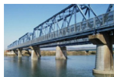
羽越本線 砂越～北余目間