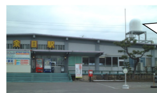
羽越本線余目駅に設置されたドップラーレーダー

2007年から専門機関とともに、ドップラーレーダーで上空の渦を検知して、その渦の予測進路上の駅間に警報を発するシステムの開発を進めており、試験観測下において、探知性能が向上してきました。今後はこのシステムを用いた列車運転規制の実用化に向けて検討を進めていきます。