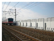
京葉線 潮見～新木場間