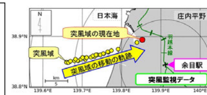
突風監視のイメージ