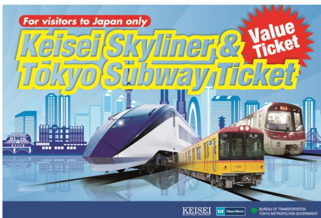
「Keisei Skyliner & Tokyo Subway Ticket」