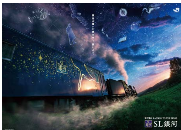
「SL 銀河」ポスターイメージ