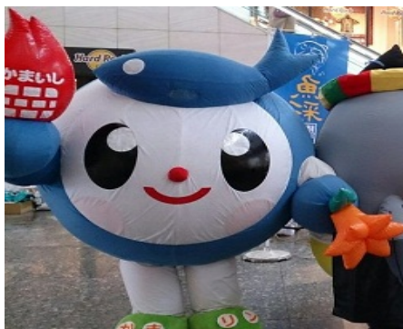
釜石市のゆるキャラ （かまリン）