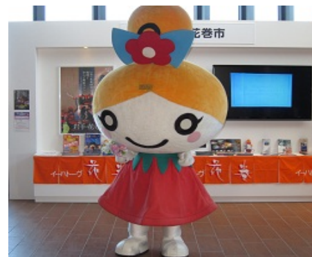
花巻市のゆるキャラ （フラワーロールちゃん）