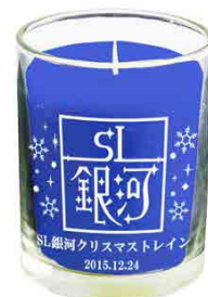
オリジナルキャンドル

エーデルワインと小岩井チーズセット(おとな) 花巻のぶどうジュースとクッキーセット(こども)