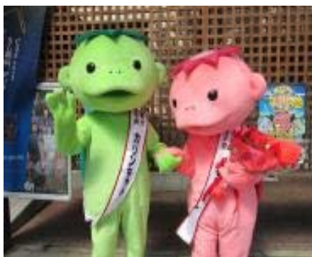
遠野市のゆるキャラ （カリンちゃん、くるりんちゃん）