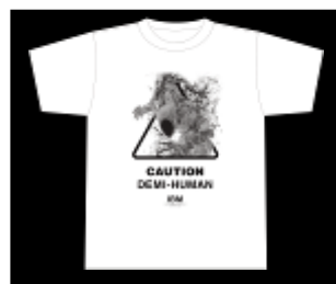
オリジナルTシャツ（非売品）