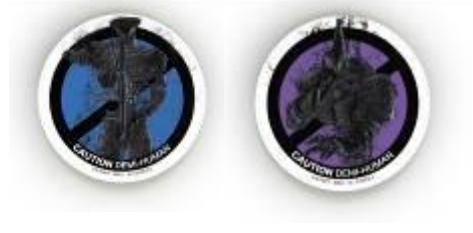
オリジナルカンパッチ（非売品）