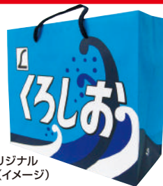
JR西日本和歌山支社オリジナル「くろしお」号手提げ袋(イメージ)