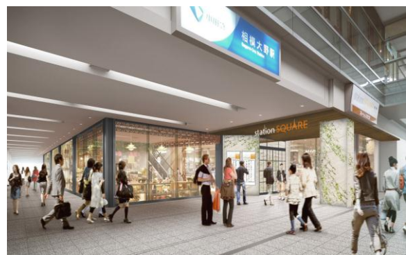
エントランス：中央改札口側（左）、コンコース側（右）（イメージ）