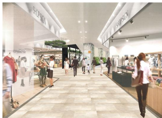
グランドフロア内（イメージ）