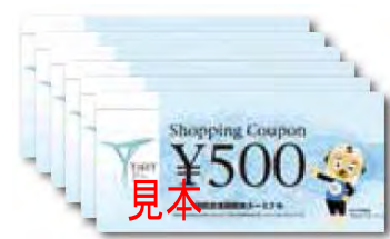
T I A Tショッピングクーポン (3,000円分)