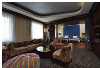
ロイヤルパークホテル サ 羽田 スイートルームペア宿泊券 (朝食付)(10万円相当)