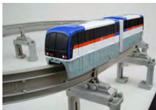
プラレール 東京モノレール 2000形セット