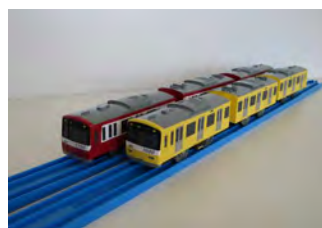
プラレール 京急新1000形ダブルセット