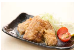
「三陸さんまのサクサク香味揚げ」 駅の串揚げ家