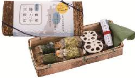
【三陸秋刀魚岩手箱】