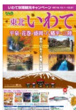
【びゅう商品告知 B1 ポスター】