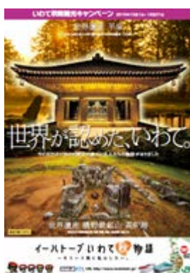
【キャンペーン告知B1ポスター】