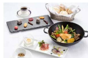
「南部鉄器ポットランチ」 フランス料理「モン・フレープ」

※「いわて黄金食財」とは、岩手県農林水産部流通課が発行している食材カタログの名称であり、同カタログに掲載されている食材をもとに、旬の食材を選定しています。 ※旬の食材を使用しているため、期間限定販売のメニューがあります。 ※対象店舗およびメニューは、予告なく変更になる場合があります。