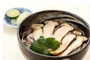
「岩手県産松茸そば」 やぶ屋