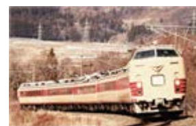
【イーハトーブ秋物語号】