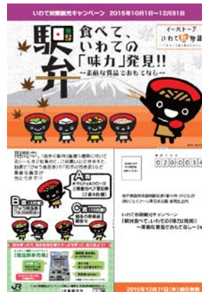
【「駅弁食べて、いわての『味力』発見!!」応募用紙】