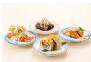
「焼き鮭といくらの親子巻」など 回転鮨 清次郎