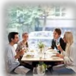
宿泊・商業・居住機能