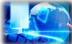
最先端ICT技術活用等