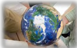
再生可能エネルギーの利用促進等により 温室効果ガスの削減に積極的に貢献