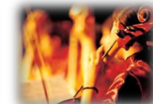
文化・エンターテイメント