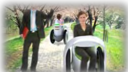
次世代モビリティ等