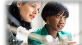
交流支援・インキュベーション支援