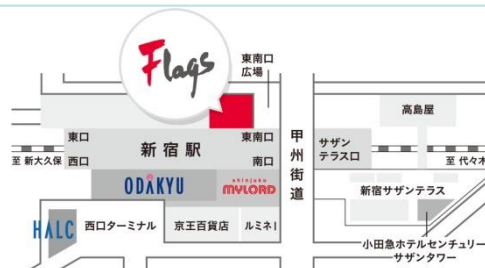
小田急線「新宿駅」南口 徒歩3分、「新宿駅」東南口すぐ

Flagsは、ファッション・音楽・スポーツなど、 様々な角度から常に新しいスタイルを 提案するファッションビルです。