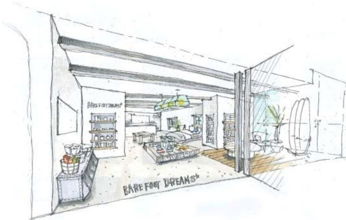
BAREFOOT DREAMS 店舗イメージ