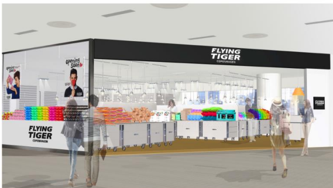
Flying Tiger Copenhagen 店舗イメージ