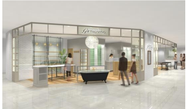
AfternoonTea GIFT & LIVING 店舗イメージ