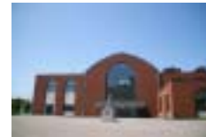
小樽市総合博物館