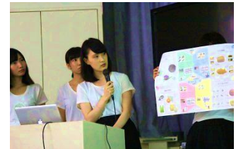
最終プレゼンテーションの様子