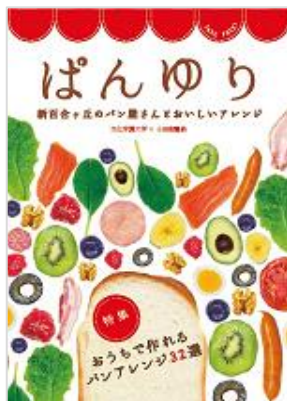
「ぱんゆり」 （新百合ヶ丘）