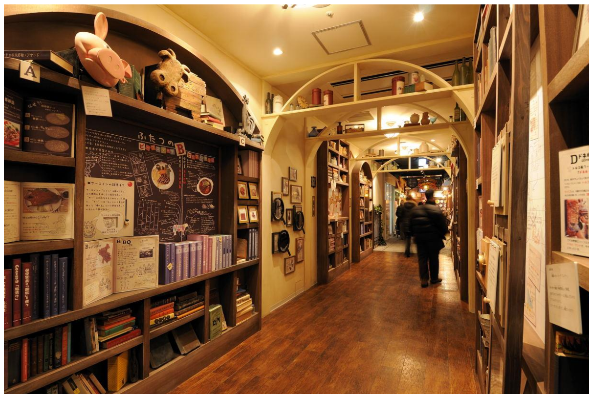
《東京ミートレア お肉のミュージアム》