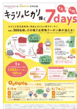
ポスターのイメージ