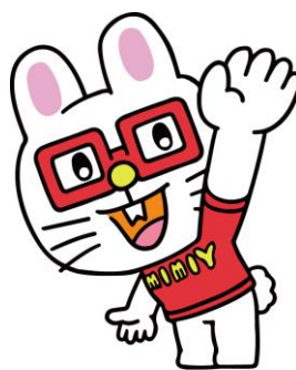
株式会社アミューズ所属キャラクター 「ミミー」