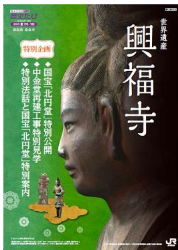
（パンフレット表紙）

興福寺では平成30年の落慶に向けて中金堂の再建工事が進められていますが、今夏は興福寺のご協力により、「国宝『北円堂』特別公開」「中金堂再建工事現場特別見学」「特別法話と国宝『北円堂』特別案内」を実施いたします。本企画はJR西日本の「ちょこっと関西歴史たび」と共同し、興福寺中金堂の再建についての情報発信にも取り組んでまいります。