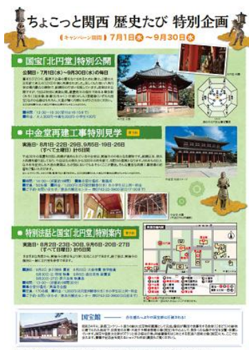
（パンフレット中面抜粋）