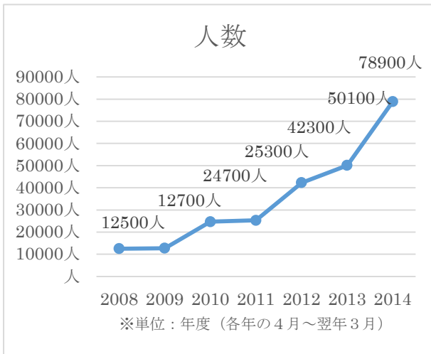
◆弊社施設に訪れた外国人観光客の推移

この度販売する企画乗車券は、神戸市バス、六甲ケーブル、六甲山上バスがセットになったチケットで電車の最寄り駅(阪神御影、JR 六甲道、阪急六甲)から1枚のチケットで六甲山にアクセスできます。販売価格を通常よりも格安(販売価格:大人1,000円)に設定することで、さらなる外国人観光客誘致を目指しています。また、チケット購入者は六甲山上のレジャー施設で入場割引や、飲食店の割引が受けられるなど、うれしい特典も満載です。