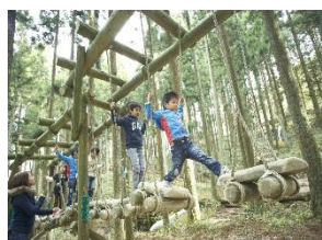
六甲山フィールド・アスレチック