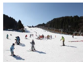
六甲山スノーパーク