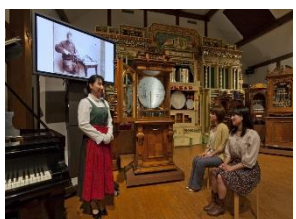
六甲オルゴールミュージアム