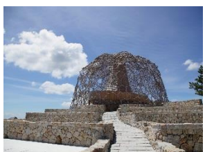
自然体感展望台 六甲枝垂れ