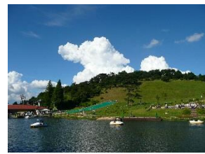
六甲山カンツリーハウス