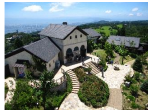
六甲ガーデンテラス