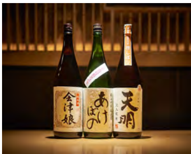
福島の地酒も揃います。

伊達鶏のカツ餃子、うつくしまエゴマ豚のライスサラダ(福島県のブランド米「天のつぶ」を使用しています。)、馬モツのポン酢かけ、会津ざくざく煮 など