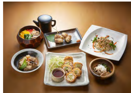
バラエティ溢れるメニュー