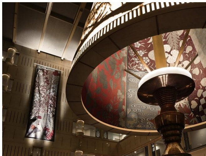
現在の2階アトリウム