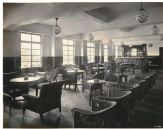
京都ステーションホテル内観