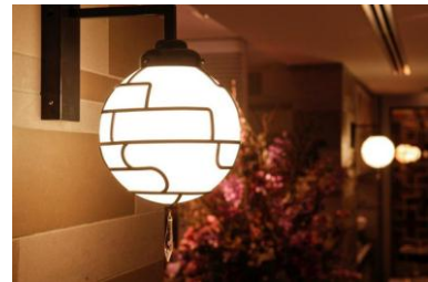
現在のメインダイニング