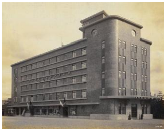
京都ステーションホテル外観