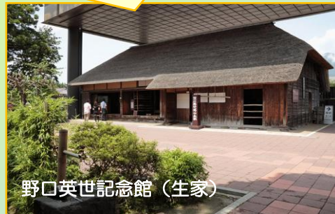
野口英世記念館(生家)

野口英世記念館4月1日 リニューアルオープン 野口英世の生涯と 研究実績が学べます。