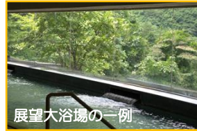
展望大浴場の一例

大川渓谷を一眺できる長さ30mに及び総ガラス張りの溪流展望大浴場をはじめ、樹齢2,000年の古代檜の浴槽に森林浴気分が入浴できる檜大浴場や岩を配した露天風呂など風呂自慢の宿です。緑したたる山々の景観を眺めながら、ゆったりと温泉を愉しんでいただけます。