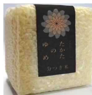
たかたのゆめ (分つき米2合)