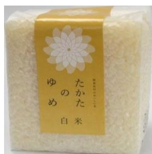
たかたのゆめ (白米2合)