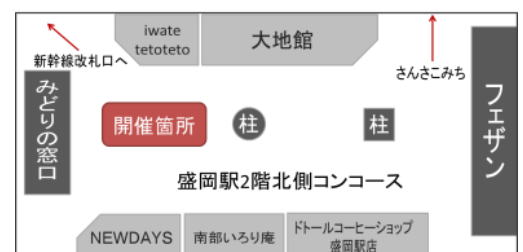
オープニングセレモニー/試食販売会開催箇所