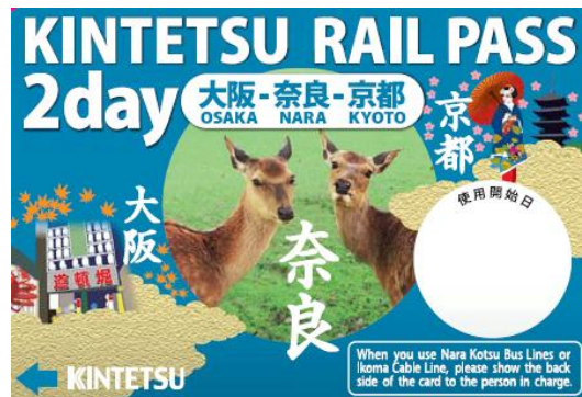
KINTETSU RAIL PASS 2day