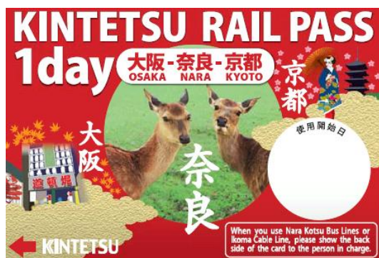
KINTETSU RAIL PASS 1day