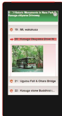
外国語音声案内機器