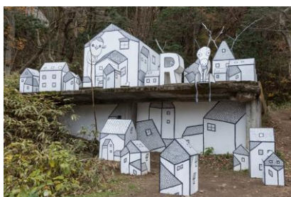
三宅信太郎 《山頂の街》