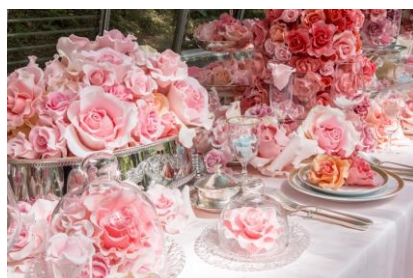
西山美なコ 《～melting dream～》