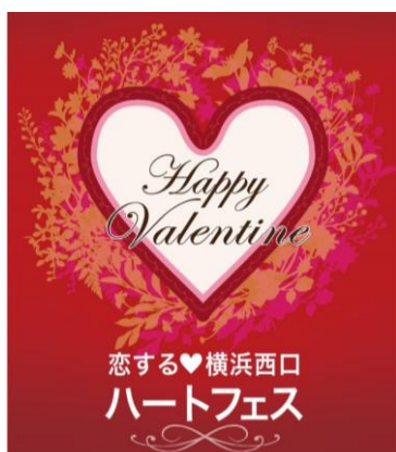
イベントメインビジュアル

【出店予定店舗】サンクトガーレン（チョコビール等）／ファミリーマート（チョコレート等）／ヴィ・ド・フランス（チョコスコーン等）／Palnart Poc（アクセサリー）／メッセージ シマミネ（アクセサリー）／HANAKOU（生花）／SALVATORE CUOMO（石釜ピザ等）／ストーブス（ハンバーガー等）／横浜国際ホテル（スープ等）／国際フード製菓専門学校（スイーツ、2月8日のみ）他