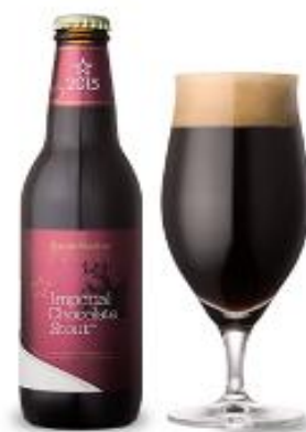
チョコビール（イメージ）