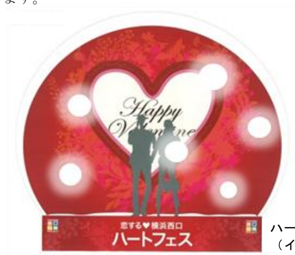
ハートスノードーム (イメージ)