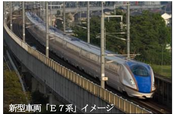
新型車両「E7系」イメージ