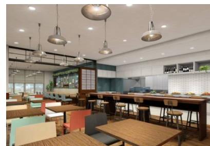
カマイシテラス Cafe & Restaurant

朝食 6:30～ 9:30 (L.O 9:00) カフェ 11:00～17:00 (L.O 16:30) 夕食 18:00～21:00 (L.O 20:30) ※事前予約制