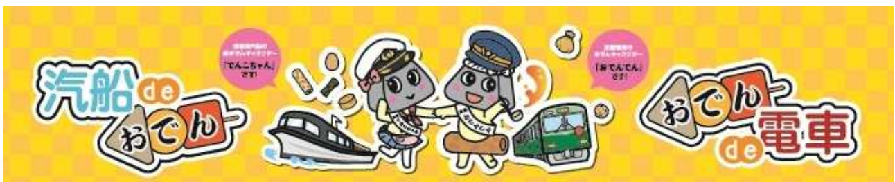
オリジナルキャラクター「でんこちゃん」(左)と「おでんでん」(右)