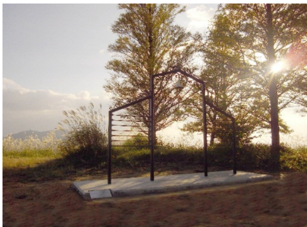
葛城高原「天空のハッピーベル」