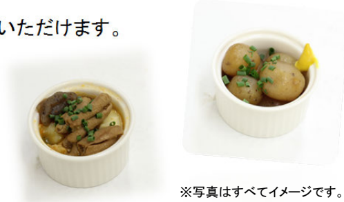
※写真はすべてイメージです。

第一回内閣総理大臣賞を受賞した「生芋こんにゃく」をはじめ、 「んまいもつ煮」「利き酒セット」 「群馬県産ブルーベリージュース」等を販売します。