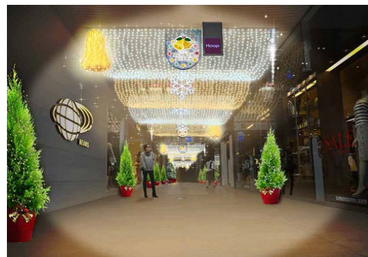
(光のゲート イメージ)

※その他、「ハルカス 星にかなでるクリスマス」ではイベント期間中、音楽にちなんだ各種イベント(「クリスマスアカペラライブステージ」、「ハルゴスコンサート2014」、「決戦はハルカス300ゴスペルコンテスト」など)を実施します。内容については詳細が決定次第、第二弾としてお知らせします。