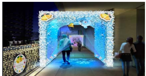
2階回廊 (西側：上、北側：下)