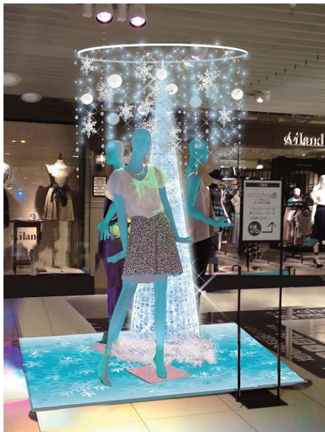
(ウイング館2階 solaha 入口 イメージ)