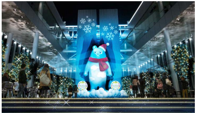
ハルカス300（展望台）58階天空庭園 イルミネーション（イメージ）