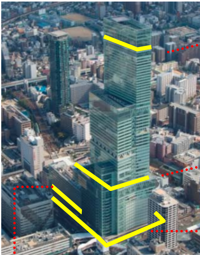
ハルカス 300 (展望台) 58階天空庭園