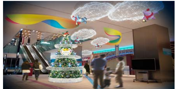
(16階ロビー イメージ)