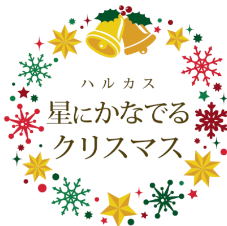
イベントロゴマーク