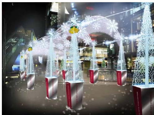
(オープンエアプラザ前 イメージ)

今年で10年目を迎え恒例となったHoopのイルミネーションは、「2014イルミネーションゲート in Hoop」と題し、1階オープンエアプラザから商業施設「and」まで繋がる長さ約120mの光のゲートが出現します。約20万球の電飾がクリスマスムードを盛り立てます。