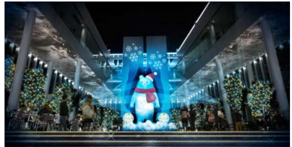
(58階 天空庭園イメージ)