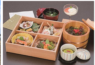
神宮会館のお食事