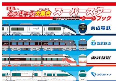
シールブック台紙（表紙）