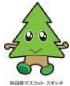
秋田駅マスコット スギッチ