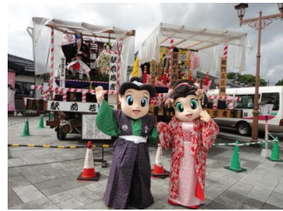
曳山&ゆるキャラ (イメージ)