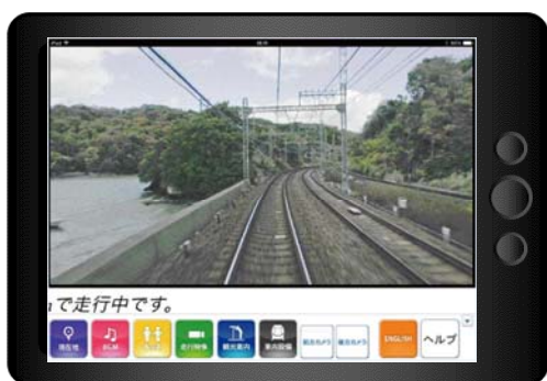
走行中の前方映像（画面イメージ）

車内に無線LAN通信設備を設置し、現在個室およびカフェの映像ディスプレイでご覧いただいている「しまかぜ」独自の映像コンテンツを配信するサービスを導入いたします。これにより、すべての座席でお手持ちの無線LAN対応のスマートフォン、タブレットPC等で、走行中の前方映像、沿線観光情報、キッズ映像などを無料でお楽しみいただけます。