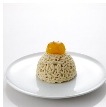
モンブラン・ジャポン