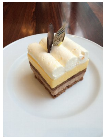
五か所みかんとミルクチョコレートのムース