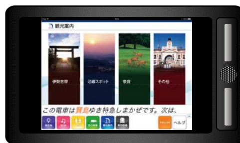
沿線観光情報（画面イメージ）