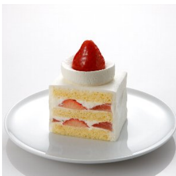
苺のショートケーキ