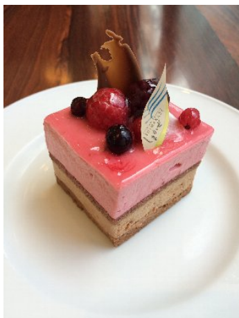
フランボワーズショコラ